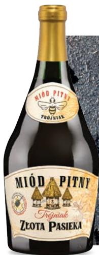
Złota Pasieka Miód pitny trójniak