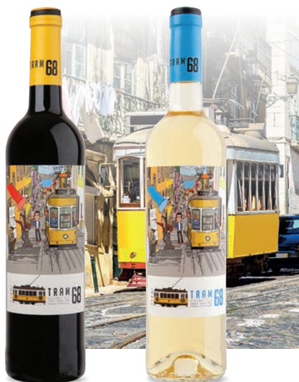
Tram 68 czerwone, wytrawne