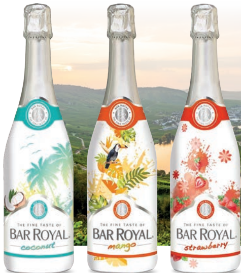
Bar Royal Kokos musujące białe, słodkie