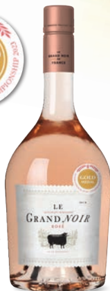
Le Grand Noir Rose różowe, wytrawne