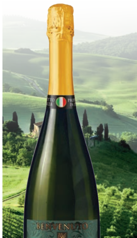
Benvenuto Spumante białe, półsłodkie