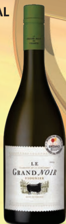
Le Grand Noir IGP PAYS D'OC Viognier białe, wytrawne