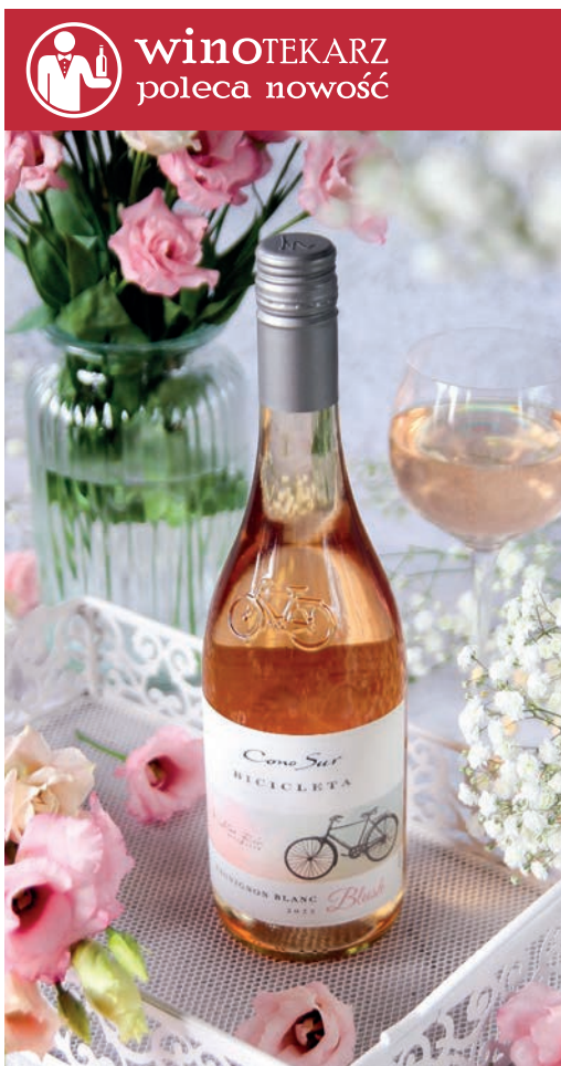
Cono Sur Bicicleta Sauvignon Blanc Blush różowe, wytrawne