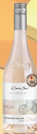
Cono Sur Sauvignon Blanc Blush różowe, wytrawne