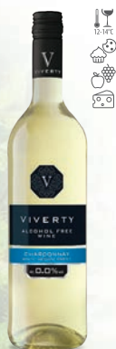
Viverty Chardonnay białe, półsuche

Wina bezalkoholowe w portfolio TIM S.A. - zapraszamy do zapoznania się z ofertą.