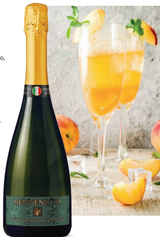
Benvenuto Spumante białe, półsłodkie