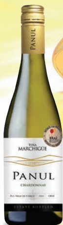
Panul Chardonnay białe, wytrawne