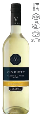
Viverty Chardonnay białe, półwytrawne