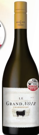
Le Grand Noir Chardonnay białe, wytrawne