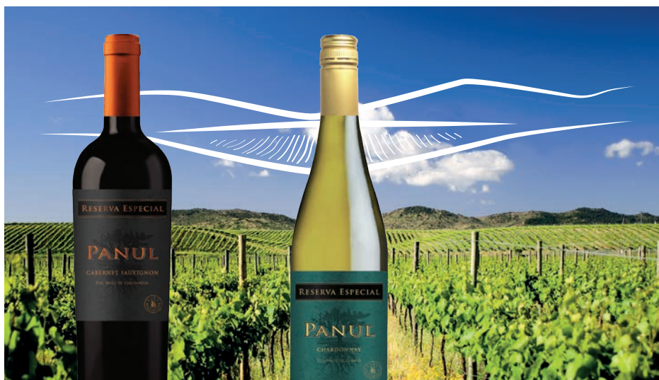
Panul Reserva Especial Cabernet Sauvignon czerwone, wytrawne