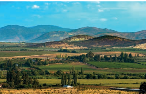
Dolina Maule, Chile.

◀ Produkcja rzemieślnicza, rocznik wina oraz indywidualny numer butelki w partii produkcyjnej