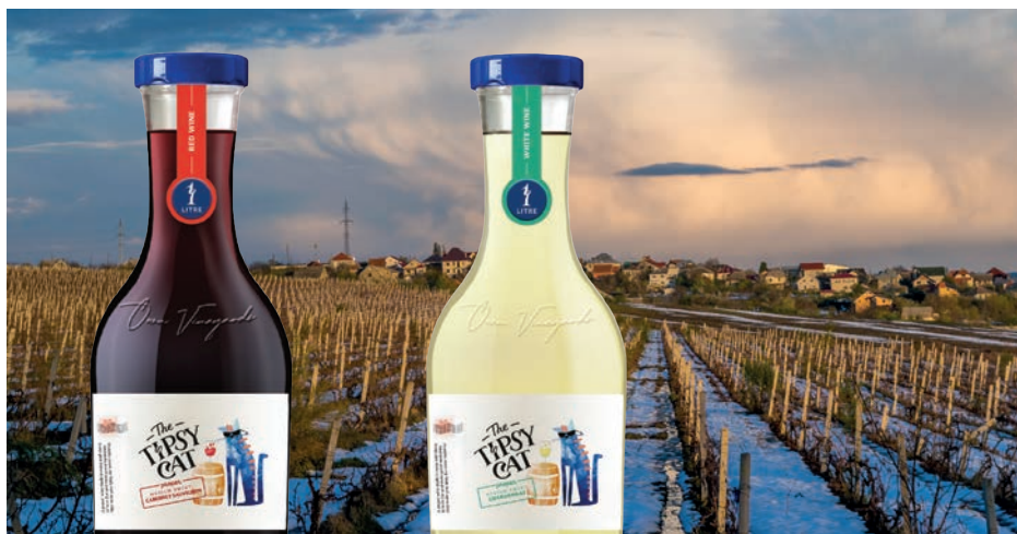
Topsy Cat białe, półsłodkie