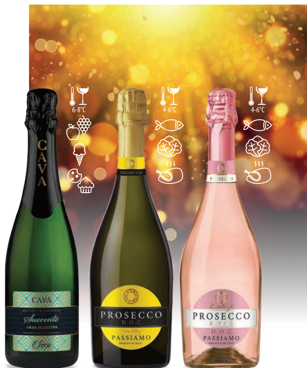
Cava Suereente Gran Selecció musujące białe, półwytrawne

Podawanie win musujących jako aperitif to znakomity pomysł, zwłaszcza gdy są one odpowiednio schłodzone. Wina musujące sprawdzą się również idealnie w towarzystwie lekkich przekąsek, dań z owoców morza lub sushi.