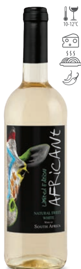
Africant Natural Sweet Chenin Blanc białe słodkie