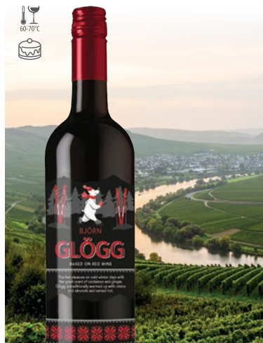
Björn Glögg aromatyczny napój na bazie wina, czerwony słodki