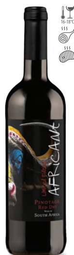
Africant Pinotage czerwone wytrawne