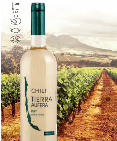
Tierra Aufera Sauvignon Blanc, Pedro Jimenez białe, wytrawne