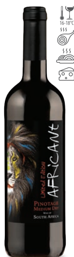
Africant Pinotage czerwone półwytrawne