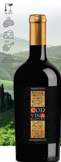
Cod Vina Appassimento Primitivo czerwone, wytrawne