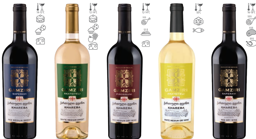
Gamziri Saperavi czerwone półsłodkie