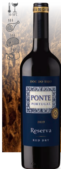
Ponte Portugal Reserva czerwone, wytrawne