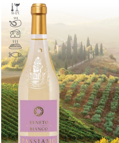
Passiamo Pecorino białe, wytrawne