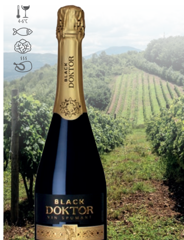
Black Doktor musujące białe, półwytrawne