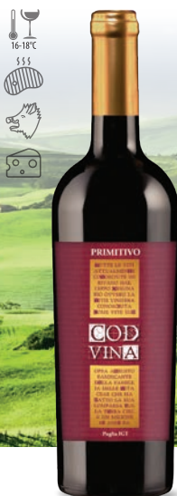
Cod Vina Primitivo czerwone, wytrawne