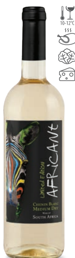
Africant Chenin Blanc białe półwytrawne