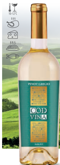
Cod Vina Pinot Grigio białe, wytrawne