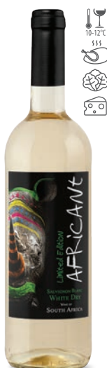
Africant Sauvignon Blanc białe wytrawne